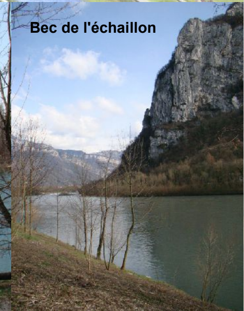
Bec de l'échaillon