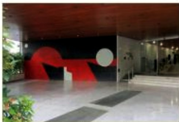
Hall d'entrée de l'immeuble Le périscope à Paris.

Dans la Persistance de la Sphère , œuvre réalisée pour la Mairie de Grenoble, Gilioli dit : « Je pars de la boule [...] » 5 , c'est-à-dire qu'il part d'une vision de la Terre, le noyau de la création, et va vers le ciel. La boule, la sphère, c'est la Terre-