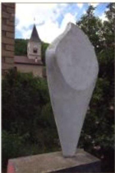
Jardin de l'ancienne propriété Gilioli à Saint-Martin-de-la-Cluze

Depuis les années 1950, il est exposé dans tous les grands musées internationaux, mais n'a malheureusement pas le même succès auprès des musées français. ■