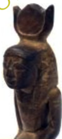
Nefertari, sculpture égyptienne. Collection privée.

Il étudie aux Beaux-Arts de Nice et aux Beaux-Arts de Paris la sculpture traditionnelle figurative mais il ira tout au long de ses créations du figuratif à l'abstrait. Il est très influencé par l'art de l'Antiquité, chaque artiste dans ses créations fait ressortir sa sensibilité et son vécu même lorsqu'il reproduit les œuvres des civilisations égyptiennes, grecques ou romaines, il est également très influ-