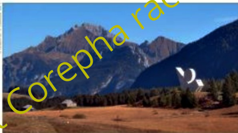
Plateau des Glières (Haute-Savoie)