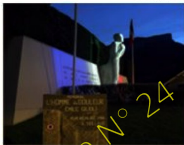
Inauguration de la plaque commémorative du mémorial L'Homme de Douleur (2017)

encé par les sculptures romanes qu'il découvre en particulier sur les chapiteaux des églises du Queyras.