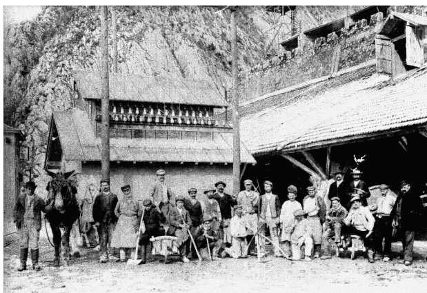
Ouvriers devant les fours de la cimenterie