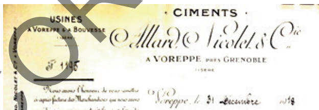
En-tête de facture de la cimenterie Allard & Nicolet