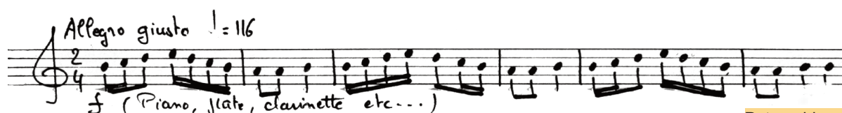
Petrouchka, danse russe