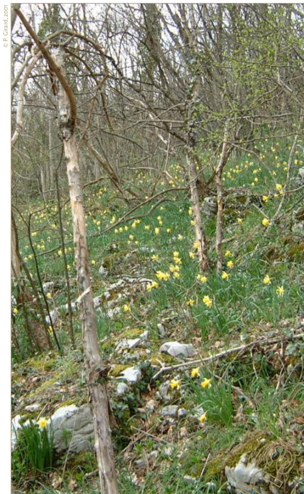
Jonquilles en sous-bois près du Belvédère

Dès l'arrivée du printemps, de nombreux Voreppins empruntent le sentier du Belvédère à Chalais, facile d'accès, pour y admirer les jonquilles égayant les sous-bois.