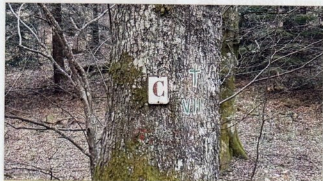
Forêt domaniale - limite de parcelle