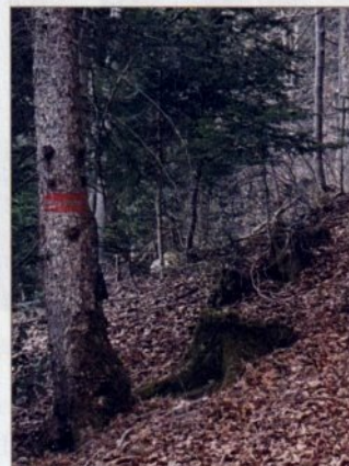
Deux traits rouges