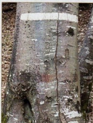
Trait horizontal blanc