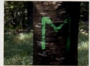
« M » vert

Il existe également des repères pour les chasseurs : un M peint en vert signifie la présence d'un mirador à proximité. ■