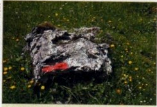
Un trait rouge