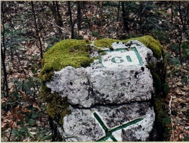
Forêt domaniale - borne

Une borne peut être une pierre taillée ou un rocher gravé. La plupart du temps c'est une pierre caractéristique qui est utilisée. Dans certaines régions elle est doublée par la présence d'une autre pierre parfaitement fendue qui leur permet de s'emboîter. Parfois c'est la présence d'arbres caractéristiques.