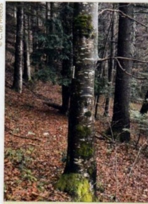
Trait blanc vertical