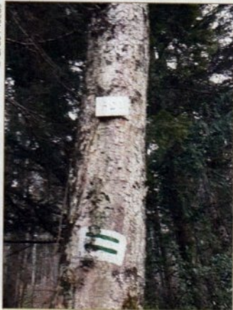
Deux traits verts