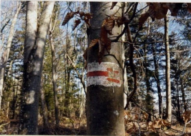
Double trait - simple trait (rouge)