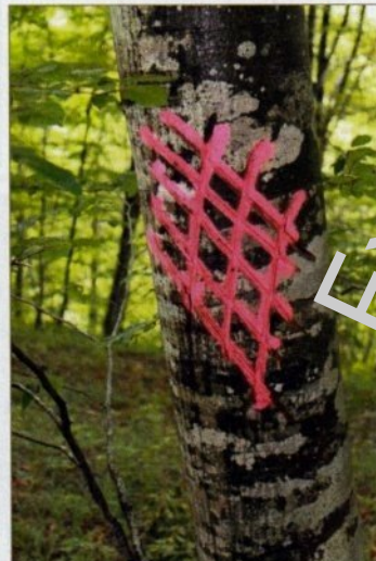
Griffes en losange

Dans la même idée consistant à préserver des arbres pour la biodiversité, on peut observer des griffes représentant des losanges.