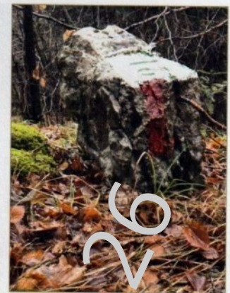
Trait rouge vertical