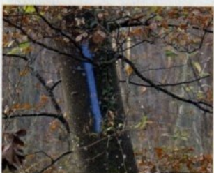
Trait vertical bleu