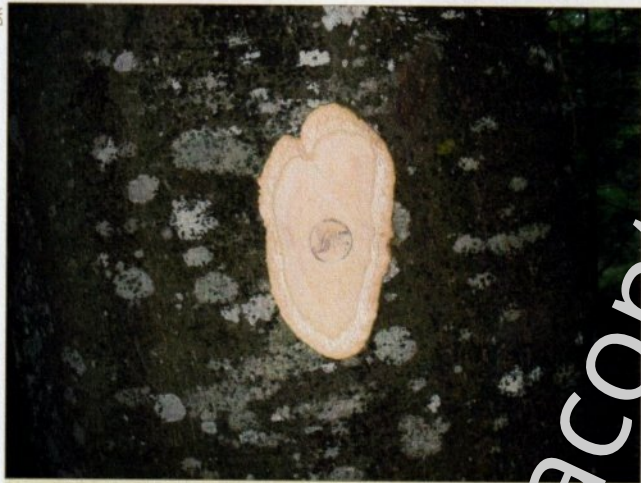
Marquage au marteau à marteler