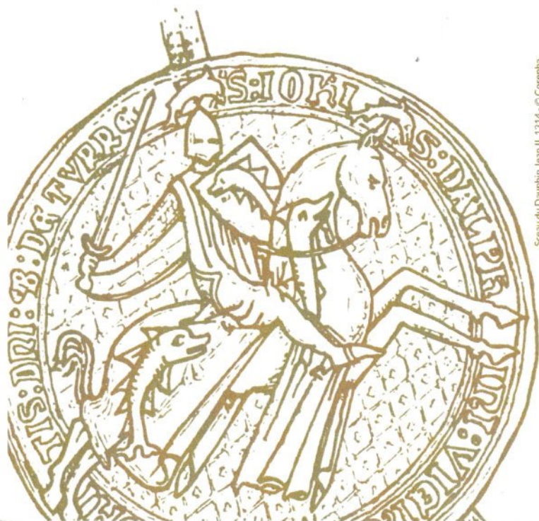
Sciau du Dauphin Jean II, 1314