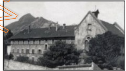
Grenoble, rue Anthoard

deux congrégations féminines sont installées depuis une cinquantaine d'années sur la commune de Voreppe : les dominicaines et les clarisses. Ces dernières ont fêté, le 14 décembre 2014, l'anniversaire de leur arrivée au clos Saint-Nizier, situé à deux kilomètres et demi du centre ville. L'ordre des clarisses remonte au XIIIe siècle, fondé à assise par sainte Claire, en dauphiné, plusieurs monastères ont existé : le groupe des sœurs venues à Voreppe occupait précédemment un bâtiment établi rue Anthoard, à Grenoble, dans ce qui est devenu le quartier e uropole. Les plus anciens des Voreppins ont bien connu quatre d'entre-elles qu'ils rencontraient dans les rues de la ville : sœur aimée, mère isabelle, toutes deux décédées. Le 14 décembre, parmi les dix religieuses résidant à Voreppe, trois d'entre-elles ont vécu à Grenoble. Leurs souvenirs furent précieux pour évoquer le déménagement de 1964.