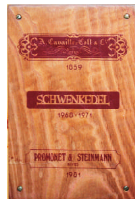
Les trois "facteurs" qui ont contribué à la restauration de l'orgue de Voreppe

Grâce à l'initiative du père Henri Bin, l'Évêché de Grenoble, propriétaire de l'orgue, décide de l'attribuer à la paroisse de Voreppe.